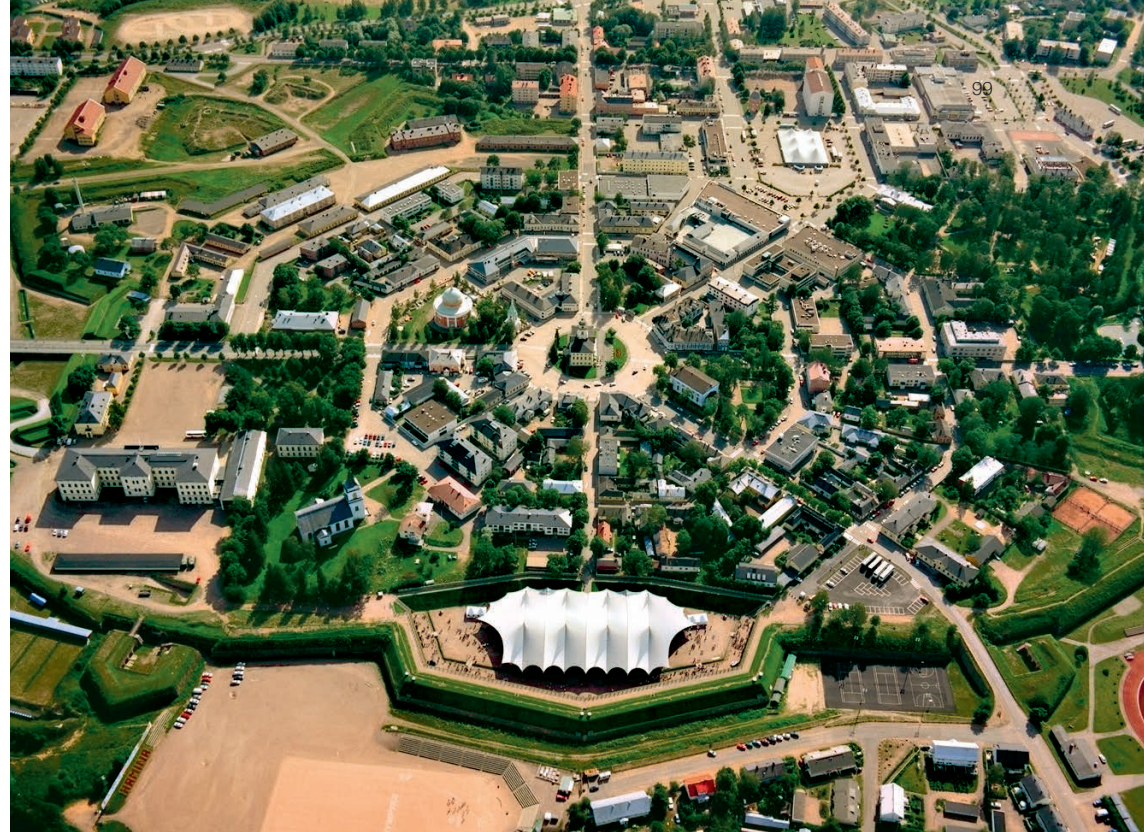
Fredrikhamns åttkantiga stadskärna är unik i Norden.

1900-talets första decennier är byggandets och sågindustrins guldålder, och det sågas friskt i Fredrikshamnstrakten. Släkterna Aladin, Bruun, Ahlqvist och Silvo bygger upp förmögenheter med hjälp av trävaruhantering i Kymmenedalen. När pappersindustrin utvecklas och förädlingsgraden stiger, minskar sågarnas betydelse. Redan vid vinterkrigets utbrott är sågindustrin marginaliserad. Bruuns verksamhet har gått i konkurs och familjens herrgård Summa är stadd i förfall. Familjen Aladins gård Poitsila är redan såld. Skogarna övergår undan för undan i storindustrins ägo.