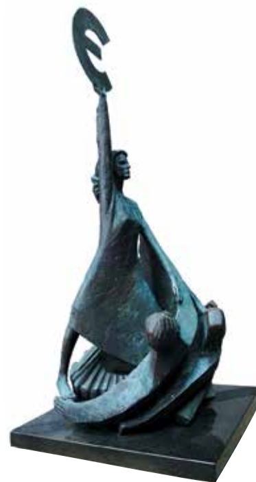
Eurostatyn utanför Europaparlamentet

Den gamla Kooperationen har blivit ganska marknadsdominerande i Finland (S-rö-