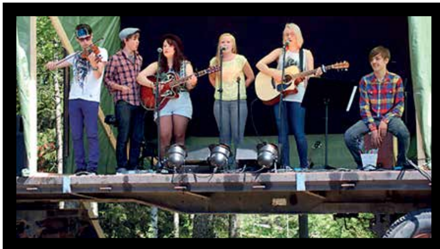
Bandcamp är ett av SÖU:s projekt med EU-finansiering.