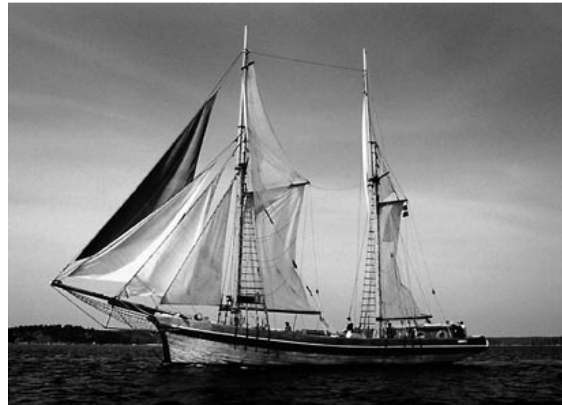
Galeasen Hoppet av Spithamn räddades för eftervärlden tack vare att hon såldes till Finland. Hoppet finns nu i Valkom hamn i Lovisa och skall efter renoveringen bli en seglande folkhögskola i Östersjön.

Genom århundradena kom dessa svenskar att slå vakt om den fredliga sjöfarten och skydda nordbornas båtar för mer rovgiriga estniska landsmän. Estlandssvenskarna blev kända som pålitliga lotsar och "mundrickar", dvs sådana som med mindre båtar ombesörjde lastningen och lossningen av de stora fartygen, som inte kunde ta in i de grunda hamnarna utan måste ankra ute på redde.